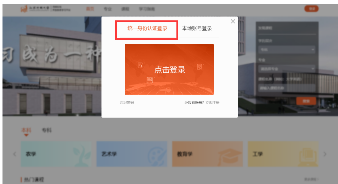
图 1-3 登录页面

进入个人首页后，依次点击“事务”-“毕业学位”-“申请学位”，进入学位申请环节，如图 1-4，图 1-5。