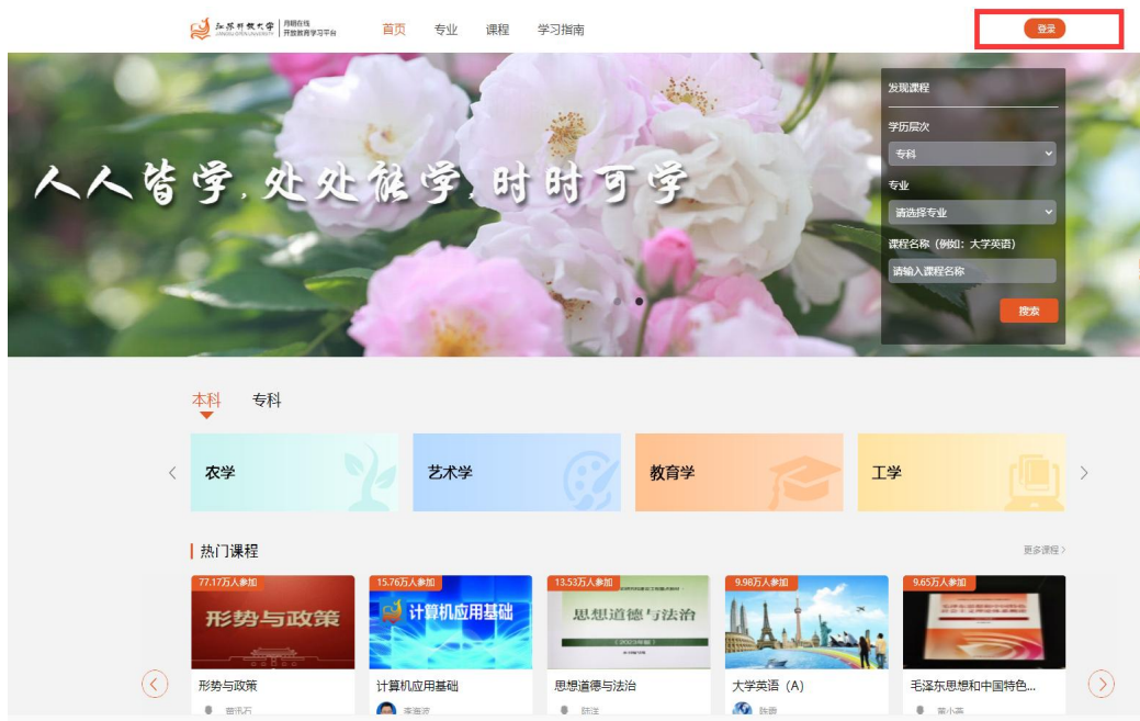
图 1-2 登录页面