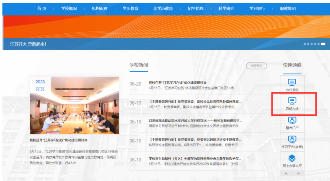
图 1-1 学校首页

打开江苏开放大学官网首页，点击右侧“月明在线”如图 1-1，或打开浏览器，输入网址： http://xuexi.jsou.cn/jxpt-web/index ，进入登录页面，如图 1-2。